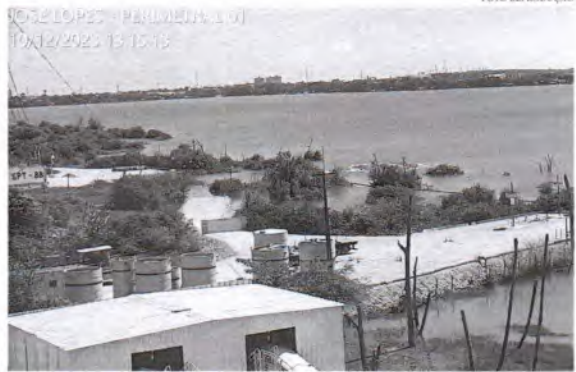
A área do rompimento está localizada sob a lagoa Mundial. Com isso, a água deve ficar altamente salinizada