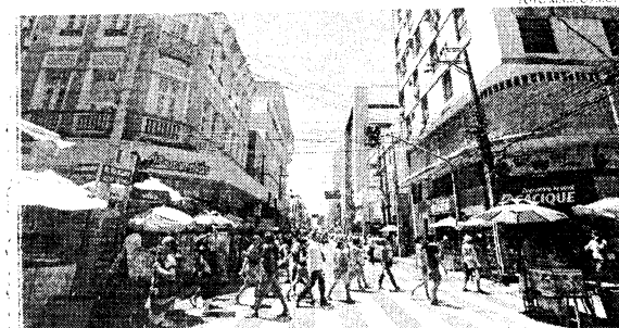
Com diminuição do isolamento social rígido, país começa a apontar crescimento nos índices econômicos

Setores econômicos como agricultura e a indústria foram essenciais para a alta, o melhor resultado desde o início da pandemia