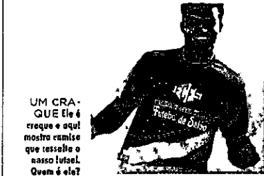
UM CRAQUE Ele é craque e aqui mostra camisa que tessele o nosso futebol. Quem é ele?