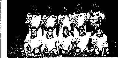
UM TIME BOM Que time é esse? Um time muito bom, diga-se de passagem.

Nunca mais tive notícias desse grande desportista. Por onde anda, meu caro professor?