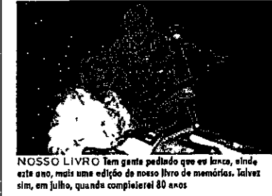
NOSSO LIVRO Tem gente falando que eu lancei, ainda este ano, mais uma edição do nosso livro de memórias. Talvez sim, em julho, quando completarei 80 anos.

Uma vergonha, para nós, tricolineiros, a goleada sofrida aqui para o Bahia. Ainda respiramos e eu estou contristado porque o Rogério Ceni brilha com o Flamengo. Outro que perdeu em casa e de goleada foi o deputado Daniel Silveira. Que perdeu na Câmara Federal por um longo margem de votos. Um espetáculo, repete.