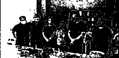
MÁSCARAS Use máscaras, pois a pandemia não acabou. Usar nos proteg e a você também. Nesse foto, há um empenho de 130, quando deve ser uma goleada por 6X0.