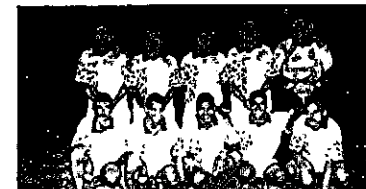
UM TIME BOM Que time é esse? Um time muito bom, digo-se de passagem.

Nunca mais tive notícias desse grande desportista. Por onde anda, meu caro professor?