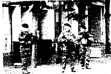
Policiais isolam as áreas próximas ao local do crime, elevando ainda mais nível de segurança na França.