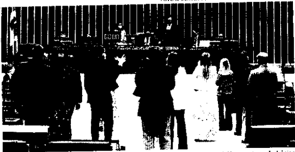
A matéria aprovada ontem na Câmara prevê mais que o dobro de gastos da União na educação básica em lei complementar.

A Câmara aprovou nessa terça-feira (21) o texto-base da PEC (Proposta de Emenda à Constituição) de renovação do Fundeb. A matéria prevê mais que o dobro de gastos da União na educação básica, passando a complementação dos atuais 10% para 23%. O texto base foi aprovado por 499 votos a favor e 7 contrários. Eram necessários pelo menos 308 votos para passar a PEC.