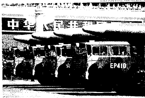
Misséis balísticos chineses DF-26, com capacidade nuclear, em desfile militar em Pequim

Mas o texto aponta muita discrepância entre o que Pequim e a principal potência de construção naval em tou-