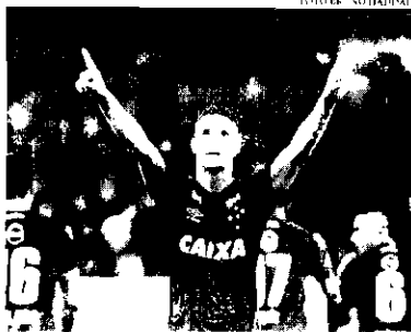
Mano Menezes festejando ainda a dúvida para confronto

Os jogadores não foram liberados para sair do hotel. O técnico Mano Menezes não quer que eles sejam abordados por jornalistas.