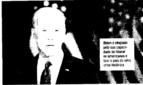
Biden é elogiado pela sua capacidade de liderar os americanos e tirar o país de uma crise histórica

Michelle Obama, símbolo de moderação e uma das figuras mais populares do partido. Michelle, porém, optou por um discurso forte, no qual disse que Trump é o presidente errado para os EUA e que está perdido na condução de governar. Donald Trump é o presidente errado para o nosso país. Ele teve tempo mais