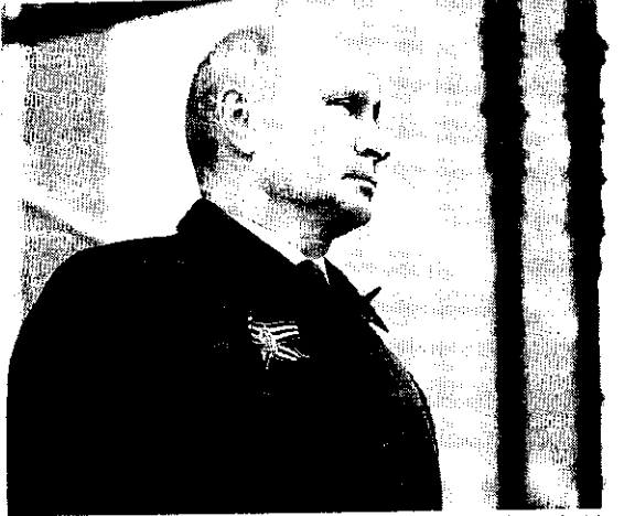
Presidente da Rússia não quer saber de estruturas europeias infiltradas junto às suas fronteiras

Lukachenko, no poder desde 1994, sempre se achou mais esperto que os russos. Obteve duas décadas de energia subdividida e ainda lucrava com a venda de derivados de petróleo refinados em seu território para vizinhos, fortaleceu sua posição interna e não cedeu controle a Moscou. Isso até o começo deste ano, quando Putin perdeu a paciência e cortou subsídios dos hidrocarbonetos que envia a Minsk. A elite local, que não tem interesse em romper laços com Moscou como