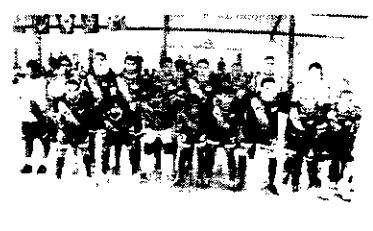
BOM TIME Toda cidade que tem um bom time, tem um bom prefeito. São Gonçalo do Amarante não podia ser diferente e hoje formato de futsal ilustra a nossa cultura. São Gonçalo tem um prefeito que gosta do esporte.

Eu admiro quando o artigo é bem escrito. E sem essa porque vai no outro jornal, eu não possa reproduzi-lo. Fernando Graziani, por exemplo, nos brindou na semana que passou com um belo artigo tipo do artigo jornalístico com dados que impressionam. Vejam o seu final e veja que números. As torcidas registram o momento inédito. Os programas de socio estão em crescimento e, nos estádios, a presença dos torcedores chama atenção. O Fortaleza, em 19 jogos da Série B como mandante, reuniu 545.340 torcedores. O Ceará, em 18 partidas em casa na Série A, teve 476.273 ingressos comercializados. São mais de um milhão de pagantes e a certeza de que os torcedores têm sido fundamentais como participantes ativos de um momento que, se bem aproveitado, representará uma revolução em todos os aspectos.