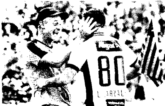
Lisca faz história e salva equipe de descenso quase certo pela segunda vez com muito trabalho

Após a pausa para a disputa da Copa do Mundo da Rússia, o Ceará iniciou uma excelente sequência de resultados, garantindo o uma das melhores campanhas por Mundial entre os 20 participantes da competição. Hoje, o Alvinegro ocupa a 12ª colocação na classificação, contabilizando