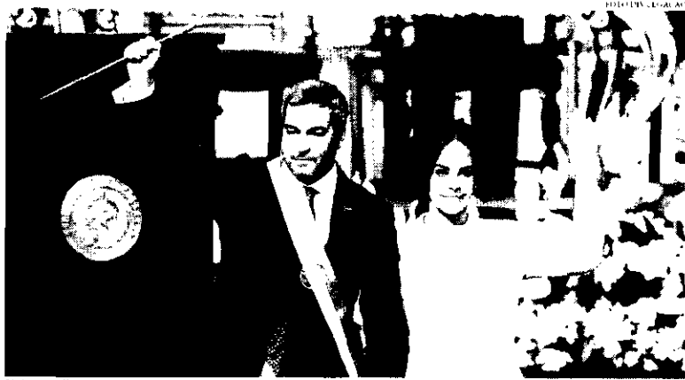
Abdo ressaltou que uma democracia madura reúne opiniões divergentes, instituições fortes, autonomia entre os poderes

Prometo um Paraguai para as pessoas, onde o cidadão seja o motor de transformação, cheia de amor à pátria, ao próximo e ideias.