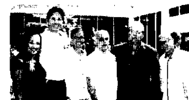
FORT NISSAN Foto da solenidade de inauguração da nova unidade da Fort Nissan.

De 23 a 25 de novembro, em Sobral, as disputas da TV Diário, com a participação de Itarna, Paracuru e Boa Via Gem. De 30 de setembro a 2 de dezembro a fase de grupos com a participação das equipes de Ceará, Aquiraz e Maracá. Em Limoeiro do Norte, de 7 a 9 de dezembro, mais uma etapa com Horizonte, Solonopole e Iacupirama do Norte.