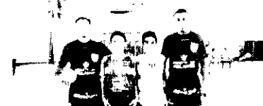
A BASE E O LUC Onde tem garoto, tem futuro. E o futsal é um esporte rico porque investe na sua base. Os garotos da foto integram as equipes de Redenção e Guaiuba.

Acontece entre os dias 1 e 3 de dezembro a etapa Final do Fest Tênis. O evento se dará nas quadras do Marina Park Hotel e as inscrições se encerram na sexta-feira, 16. As categorias em disputa são: Infante Juvemil e Tenis Kids e conta pontos no ranking da CBF e Pontuação U3. Mais informações pelo fone: (85) 99653.5881.