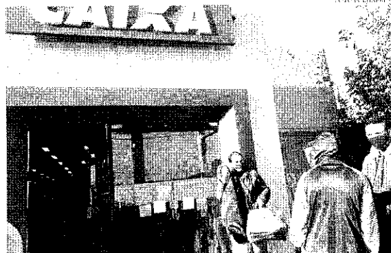
Cidadãos fazem fila em frente a uma agência da Caixa para resgatar benefício