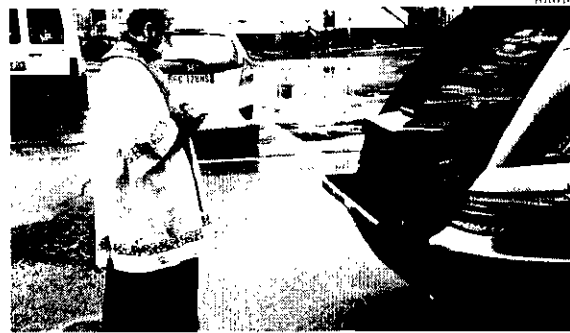
Padre em Portugal acompanha corpo de mais uma vítima da pandemia

Pelo menos 185 países já foram afetados e mortes já passam de 200 mil. Dos 3 milhões de casos, quase um terço é nos EUA