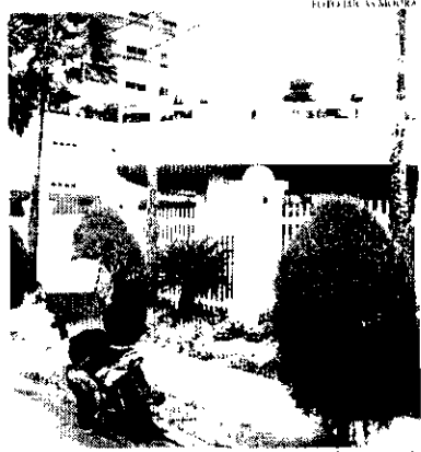
Locais que não ofereciam serviço de vendas por aplicativo estão se adaptando

Exemplo disso são os restaurantes localizados em shoppings, que até então alguns deles ainda não trabalhavam com a opção de delivery e, agora, estão adequando os serviços para atender. O Hard Rock Café, no shopping RioMar Fortaleza, e um deles. O restaurante estava no iFood pela primeira vez oferecendo uma variedade de hambúrgueres, sobremesas e entradas, inclusive o lançamento do "the Big Cheeseburger", já disponível no aplicativo de pedidos. No shopping RioMar Kennedy, o tradicional Kina do Peão Verde também precisou se adaptar. Anteriormente, o restaurante estava em processo de implantação do serviço de delivery, mas após decreto do Ceará, o início da operação foi antecipado. Com essa alternativa, o restaurante já está começando a receber os primeiros pedidos. Já são pelo menos 20 esta-