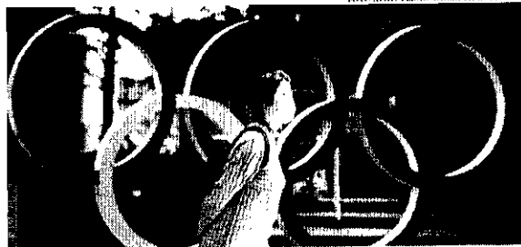
Com grandes eventos já remarcados para outras datas, Olimpíadas de Tóquio ainda estão mantidas