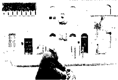
Quem mora na Lombardia e noutras 14 províncias do centro e norte do país precisa de uma autorização especial para viajar

A Itália adotou medidas drásticas para tentar conter o novo coronavírus que está se espalhando rapidamente pelo país. O primeiro-ministro italiano, Giuseppe Conte, assinou um decreto que, na prática, coloca 16 milhões de pessoas em quarentena. Qual quer pessoa que viva na região da Lombardia e outras 14 províncias do centro e norte do país precisa de uma autorização especial para viajar.