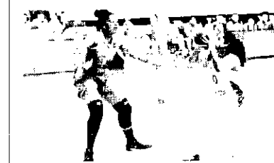
PRE-OLÍMPICO MUNDIAL. Disputando uma vaga para o Olimpíada de Tóquio, o basquete feminino brasileiro perde, de virado, para Porto Rico e compõe sua presença nos Jogos. O time de João Neto ainda teve a bola do jogo nos segundos tempos, mas o craque O'Neil decretou o triunfo de Porto Rico por 91 a 89.

Projetado pelo arquiteto Donald Skell (Rooting Plan) o Championship Course de 18 buracos par 72 do Clube de Golfe Aquiraz Riviera conta com um percurso total de 6.975 jardas, sendo constituído por dois campos: Ocean Course (104) e Dunes Course (volta) no total de 90 hectares.