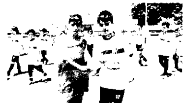
PAZ NOS ESTÁDIOS Que a paz que estes garotos celebram no estádio, seja estendida aos clássicos maiores de nosso futebol.