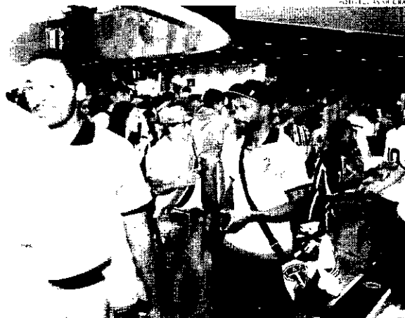
Jogadores fizeram questão de cumprimentar torcida e agradecer pela recepção calorosa em regresso

"Mil gols, mil gols, mil gols mil gols mil gols, só Pele, só Pelé, eu sou mais Cariús", entoavam os fanáticos para saudar o artilheiro isolado da Série D com dez gols marcados até aqui. "Conseguimos superar bem a pressão e as dificuldades de jogar em um gramado sintético, tudo muda, a bola vai mais rá-