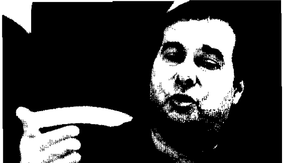
Para Maia, a estabilidade no serviço público deve ser condicionada a regras mais firmes

de [funcionário público] presta a sociedade", disse.