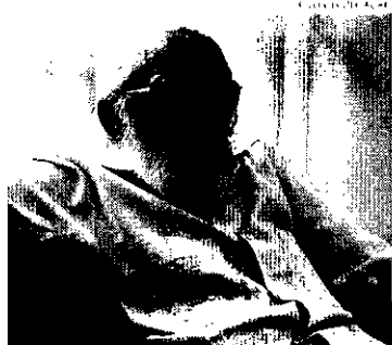
Paulo Freire. O empenhamento patriota da educação brasileira

Frase: "Acredite em milagres, mas não dependa deles". De um tal de Immanuel Kant. Sabe quem foi?