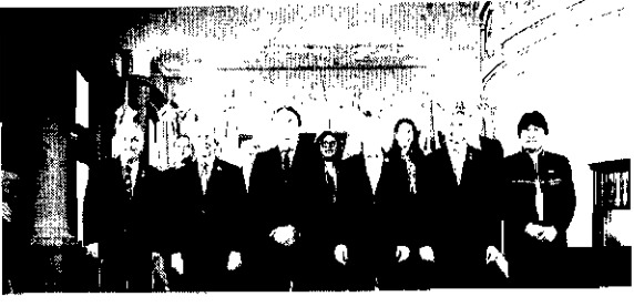
Cúpula será marcada por duas transições - será a última dos atuais governos da Argentina e do Uruguai

O evento ocorre nessa quarta-feira (3), com a reunião dos ministros da economia e das relações exteriores, e amanhã (4), com os presidentes. A ideia inicial dos mandatários da Argentina e do Brasil era terminar finalmente com o vicer-reino setecentista do Paraguai e a baixa de modo substancial a tarifa externa comum. A informação foi dada pelo chanceler argentino, Jorge Faurie, na última semana. 'Formamos um grupo de trabalho no começo do ano, e os quatro países concordaram que nossa taxa é muito alta, o que diminui a competitividade das quatro economias. Também concordamos todos que devemos trabalhar sobre isso para diminuir as diferenças', disse Faurie. A taxa vigente há mais de 20 anos tem média de 12% em alguns setores, como o automotivo, e de 35% e das mais altas do mundo. Enquanto isso, o chanceler afirma que esse tema será debatido e que se esperam avanços: o ministro da Produção argentina, Dante Sica, sinalizou que será difícil avançar neste tema a menos de uma semana de deixarmos o governo. A tarifa externa comum é vista pelo presidente eleito da Argentina, Alberto Fernández, como necessária para proteger os produtores nacionais. Um dos motores de sua campanha foi a promessa de que iria 'priorizar a indústria nacional'. Isso significa, na prática, voltar a adotar medidas protecionistas, algo que a esquerda Bolsonaro-Macri não desejava.