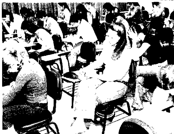
Ao todo, são 1.027 escolas já participam da iniciativa, e o governo espera que esse número cresça

O Ministério da Educação (MEC) divulgou nota ontem (12) anunciando o empenho de R$ 118,3 milhões do Fundo Nacional de Desenvolvimento da Educação (FNDE) para reforma e funcionamento de escolas de ensino integral em 16 estados. Os recursos podem ser usados para contratação de obras para escolas e compra de equipamentos (despesas de capital) ou para o pagamento de contas como água, luz, telefone (despesas de custeio). O dinheiro faz parte da parcela do Programa de Fomento às Escolas de Ensino Médio em Tempo Integral. A primeira parcela foi liberada em novembro do ano passado. Ao todo, são 1.027 escolas que já participam da iniciativa.