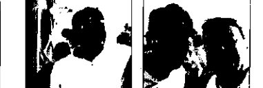
2 - O vereador Benigno Júnior foi figura vista no Raimundo do Queijo.