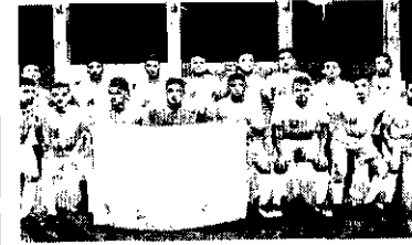
QUE TIME? Me mandaram esta foto. Trata-se de um time do nosso futsal. Que time é este?