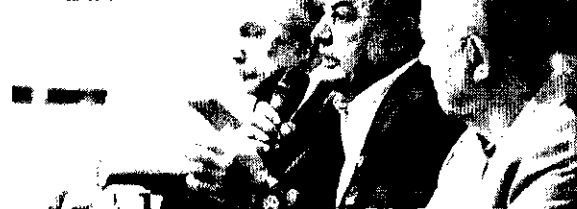
Nome indicado por Zezé Perrella é preso antes de fiscalizar contas do clube