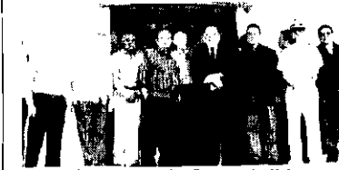
90 ANOS. Bastaria esta citação e pronto. Hoje o Náutico Atlético Cearense completa 90 anos de existência. O Náutico é um patrimônio cultural, social e esportivo de nossa terra.

Como e que se tira uma pessoa que caiu muito pouco? Completamente molhada.