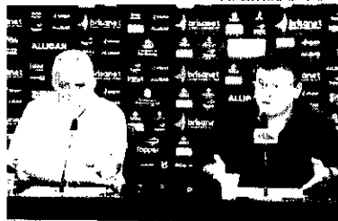
Dirigentes destacaram que clube quer goleiro e centroavante