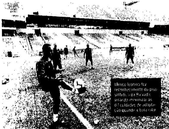
Elenco leonino fez reconhecimento do piso sintético da Barxada visando minimizar as diferenças de adaptação quando a bola rolar