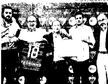
Parceria já será vista no uniforme na partida diante do Flamengo

Essa é a primeira vez que a empresa investe em um time de futebol. De acordo