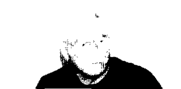
UM HOMEM DE BEM Na coluna um homem de bem. Um craque de futebol e de futebol de salão. Um homem que brilhou dentro e fora de campo. Com vocês, o coronel Haroldo Castelo Branco.

Sílvo Carlos, como ex-presidente do clube, vai mandar confeccionar 42 faixas de campeão ativas a os 47 títulos do clube. Promoverá um jantar do Leão, no Sirigado, e começará a vender esta semana ainda. A reserva já está sendo feita.