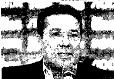
Luxemburgo assume Gigante da Colina na próxima segunda

"Tem sempre um rotulado como o cara que queria ser o mandão do futebol, mas eu só queria que houvesse um crescimento com profissionais. Uma comissão técnica mudada, alguns nos clubes e hoje se tem isso. Hoje vou