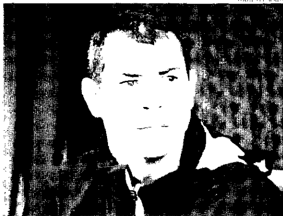
Treinador assumiu que sentiu algo diferente quando surgiram primeiros boatos de sua possível volta

"Isso mexeu muito comigo na Arabia Saudita, quando começaram os comentários de uma possível