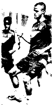
Alacante chega para suprir ausência de Keno e já era tentado desde antes da chegada de Felipeão