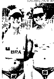
Angela e Carolina Horta faturaram o ouro em Brasília

Tendo lutado as quatro etapas disputadas até agora no mapa feminino, o Brasil lidera o ranking continental com 800 pontos. A Argen-