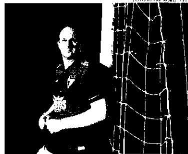
Técnico entende que ainda precisa de reforços para a sequência da temporada e pode optar por time alternativo no Nordeste

Entretanto, pela frente, o atual campeão da Série B do Campeonato Brasileiro não tem moleza e da mesma for-