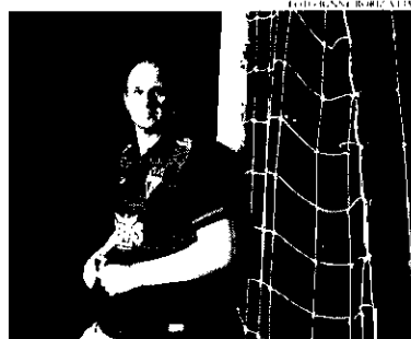
Técnico entende que ainda precisa de reforços para a sequência da temporada e pode optar por time alternativo no Nordeste

Entretanto, pela frente o anual campeonato da Série B do Campeonato Brasileiro não terá moleza e da mesma for-