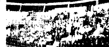
O FUTSAL CHINESE É uma verdade. Dia a dia cresce a quantidade de torcedores nos jogos de futsal que vem atravessando uma fase de ouro.