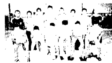
CAUCAIA SUB 15 A CBFS tem um CT dos mais interessantes e este grupo a que pertence a ela.

Ele tem conceitos sobre a vida dos mais interessantes. Um dia desses lhe perguntaram se ele acreditava no infante. E eis a resposta dele: acredito sim e é a velhice. E agora vejamos o que ele diz sobre parabenizar aniversariantes que pode ser aceitável. Agora lascativo são os parabenismos, pois não é permitido congratular quem está ficando mais velho. E, portanto, se aproximando da morte inevitável.