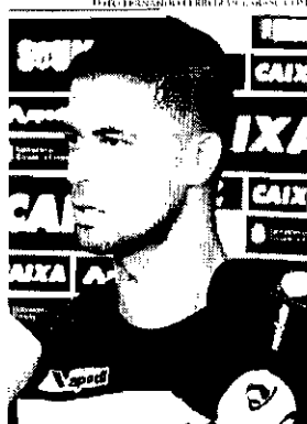
Centroavante estava em baixa no Vozão, mas vent balançando as redes e a confiança voltou

O camisa 9 não tem tido um desempenho elogiável nesta segunda passagem pelo clube e, de acordo com a lista, as conversas têm sido poucas. "Tive papo com ele, coisa de confiança, de passar tranquilidade", valorizando sempre o profissional. Muitas vezes e preciso dar um passo