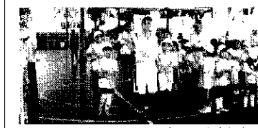
A BASE Um dos motivos do crescimento do futsal no Ceará é o investimento na base. Essa garotada, aqui, tem certames o ano todo.