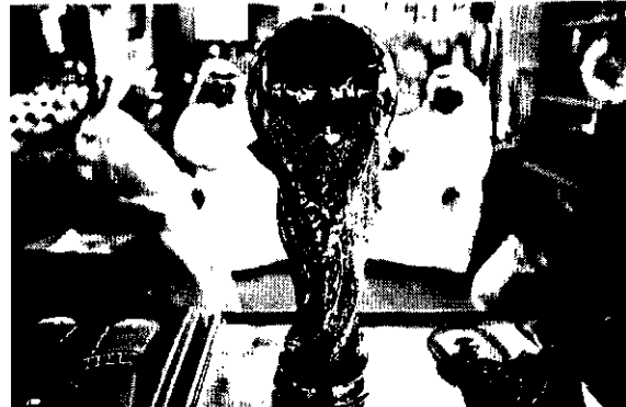
Governo do Qatar teria pago duas parcelas de US$ 400 milhões e US$ 480 milhões para ter evento

O jornal britânico The Sunday Times traz na edição desse domingo (10) a informação de que o Qatar pagou US$ 880 milhões (R$ 3,4 bilhões) para ser o país sede da Copa do Mundo de 2022, o que seria o mais novo escândalo de corrupção envolvendo a Fifa. O caso teria acontecido em 2010, quando Joseph Blatter ainda era presidente da entidade. De acordo com a publicação, o canal de TV Al Jazeera, financiada pelo governo do Qatar, pagou duas parcelas de US$ 400 milhões e US$ 480 milhões, três anos depois, a Fifa pelo país ser oficializado como sede do Mundial em cumprimento a contrato assinado 21 dias antes da decisão, em 2010.