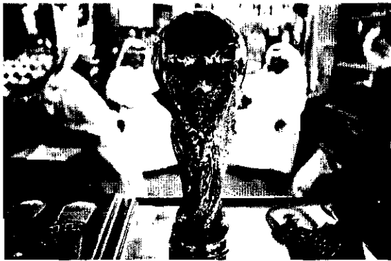
Governo do Qatar teria pago duas parcelas de US$ 400 milhões e US$ 480 milhões para ter o evento

Isso representou um enorme conflito de interesses para a Fifa e uma violação de suas próprias regras, já que o país era financiado pelo governo do Qatar. O dono da Al Jazeera na época era o emir do Qatar Sheikh Hamad. O pequeno estado do Golfo árabe desenvolveu para sediar o maior evento esportivo do mundo. Um vasto acordo de TV oculto que quebrou as regras de licitação mostra até que ponto ele estava preparado para ir, conta o The Times, que informa ter tido acesso a documentos que mostram o acordo entre a entidade e a TV.