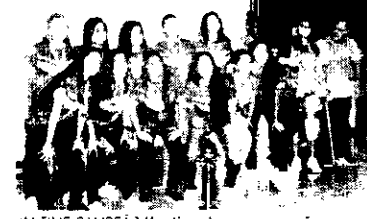
JM TIME CAMPEÃO Um time bom e campeão: uma taça linda. Veja aqui hoje.