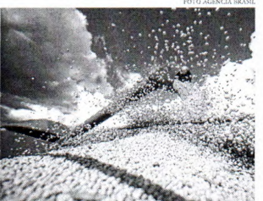
A safra pode consolidar o Brasil como um dos principais produtores de grãos do mundo

Entre os destaques da produção estão a soja, cuja colheita da oleaginosa já atinge 14,8% da área plantada, e a expectativa de 1,6 milhão de toneladas produzidas, um aumento de 18,3 milhões de tonela-