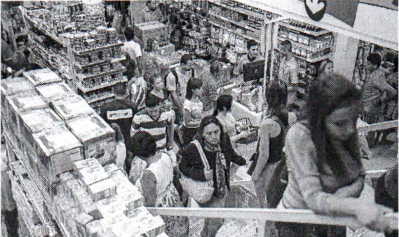
O consumo das famílias aumentou 5,2%, refletindo um mercado de trabalho aquecido

trilhões, o maior da série histórica, e o PIB per capita alcançou R$ 56.796. Apesar desses avanços, um ponto de alerta é a queda na produtividade, que recuou 0,3% em relação a 2023, mantendo uma tendência de estagnação dos últimos anos.