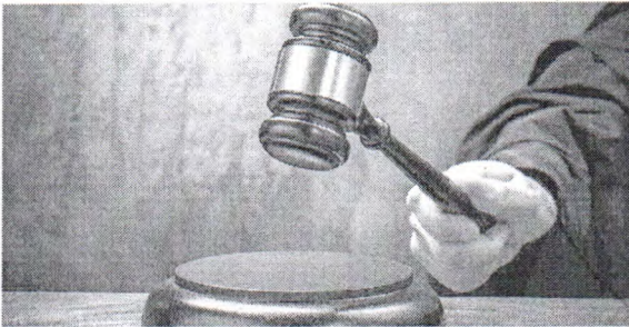
Trump quer o fim da concessão automática da cidadania americana a quem nasce nos EUA, mas é filho de imigrantes

A magistrada acatou os argumentos de dois grupos de direitos dos imigrantes e de cinco mulheres grávidas que argumentaram que os filhos correm o risco de ter a cidadania americana negada com base no status de imigração dos pais. Já a decisão do juiz de Seattle, foi tomada em ação movida pelos Estados de Arizona, Illinois, Oregon e Washing-