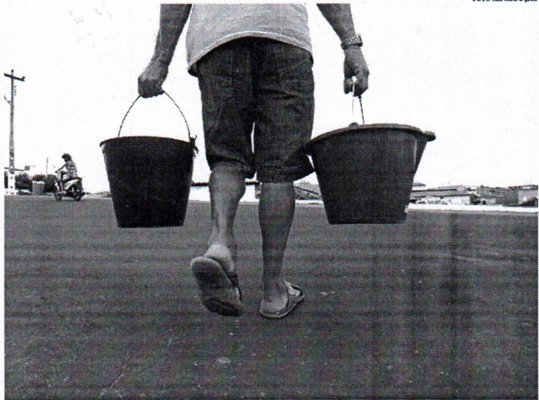
A falta de água acontece com mais frequência no Loteamento Smart City Aquiraz

Os consumidores afirmam que passaram pela mesma situação com o desabastecimento no Carnaval, Semana Santa e desta vez, na Proclamação da República