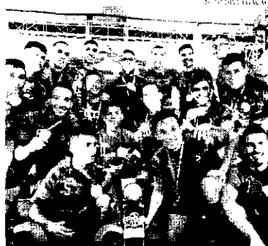
Doze Futsal sagra-se campeão da SuperCopa LFA de Futsal Adulto da edição de 2018 ao vencer o Laranjinha por 4x1, em dezembro

A entidade, inclusive, realizou-se recentemente ao movimento esportivodolista, que conta com adesão de vários estados do Brasil. Dentre eles as ligas paulista, catarinense, carioca e gaúcha.