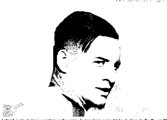
Lateral é cria da base corinthiana e foi campeão brasileiro como titular do time de Carille em 2017

O postal diz, ainda, que inicialmente o time espanhol queria que o Corinthians comprasse o atleta, mas o clube descartou essa possibilidade. Arana foi vendido por 10 milhões de euros (cerca de R$ 43 milhões na época). Ao clube do Parque São Jorge, o único modelo de negócio que interessa é o empréstimo do jogador, com o Sevilla ainda