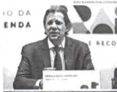
Pacote faz parte de uma medida provisória que deve ser editada pelo governo ainda em 2023