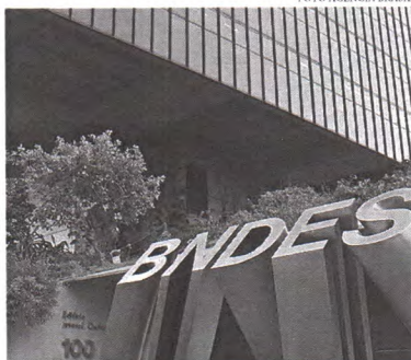
Um desses projetos a ser financiado será o plano da Nova Indústria Brasil

Nos últimos seis anos, o BNDES vinha trabalhando com a Taxa de Longo Prazo, que é de mercado, sem subsídio. Com a mudança de governo, começaram as flexibilizações. Um exemplo é a proposta do projeto de lei 6.235, que prevê taxas preferenciais, de três ou cinco anos,