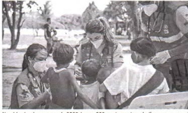
Nos 11 primeiros meses de 2023, houve 308 mortes na terra indígena yanomami