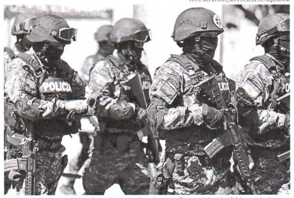
Os agentes de segurança do país continuam realizando operações em todo o território equatoriano

O presidente do Equador, Daniel Noboa, confirmou a libertação de todos os funcionários das sete prisões que estavam sendo feitos de reféns por detentos em decorrência de motins no contexto da crise de segurança pública que está sendo enfrentada pelo país.