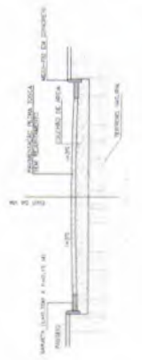
SEÇÃO TIPO DA PAVIMENTAÇÃO