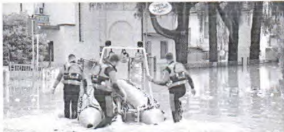
As chuvas intensas forçaram o cancelamento do Grande Prêmio de Fórmula 1

Com as chuvas intensas, muitos moradores chegaram a ficar ilhados e o caso fez com que o Grande Prê-